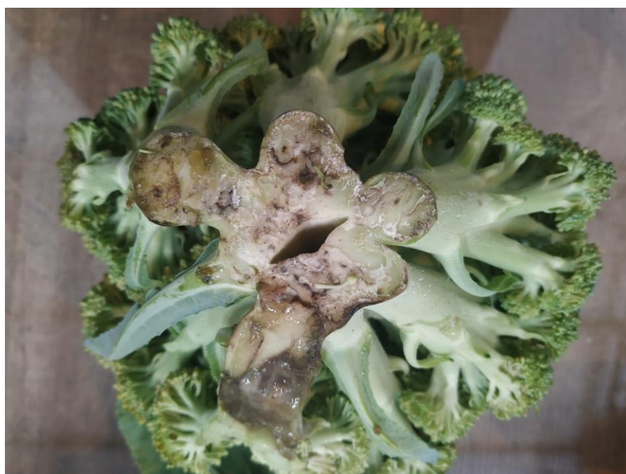
Figura 1 – Brócolis reprovado do fornecedor CH Comercial Ltda.