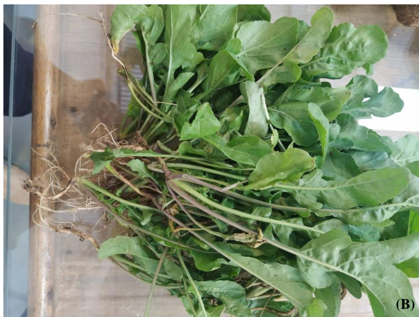
Figura 1 – Itens aprovados do fornecedor CH Comercial Lda: (A) Inhame; (B) Rúcula.