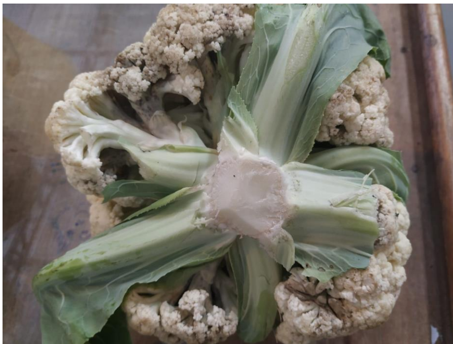
Figura 1 – Couve-flor reprovada do fornecedor CH Comercial Ltda.